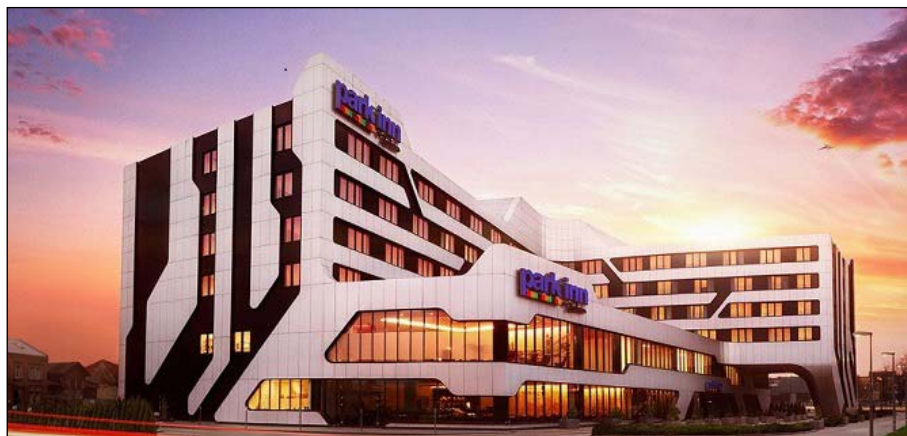
Hotel Park Inn

Ze względu na szczególny walor edukacyjny wstęp na pierwszą sesję będzie bezpłatny . Chcemy w ten sposób zachęcić do udziału w niej tych, którzy nie mogą wziąć udziału w całym Sympozjum – studentów oraz kolegów ze środowisk naukowych. Będzie to okazja do bezpośredniego kontaktu z przedstawicielami Ministerstwa Zdrowia oraz AOTMiT. Liczymy na gorącą dyskusję na zakończeniu sesji.